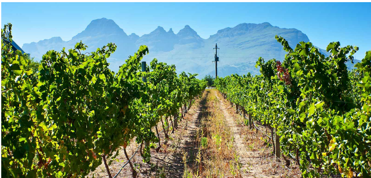
Der «Helderberg» mit den Reben von Longridge Wine Estate (Region Stellenbosch)

Besuchen Sie das schöne Weingut mit Restaurant doch einfach virtuell http://www.longridge.co.za oder wenn Sie wieder einmal Südafrika besuchen, finden Sie dort auch die schönsten Golfplätze.